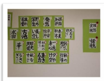
書の展(小・中学生の部)