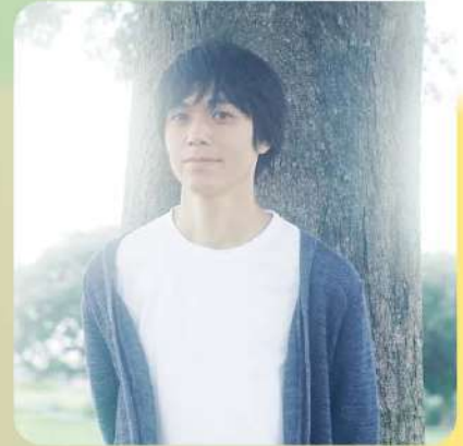
小山田壮平 Oyamada Sohei

作詞作曲/ボーカル/ギター/電子楽器/サウンドプロデューサー。1997年バンドLaB LIFEでデビュー。2000年柏原譲とPolarisを結成。デビュー以来5枚のフルアルバムをリリース。数多くの野外フェス等に出演し、多くの人々を魅了し続けている。ソロでは、数多くのアーティストとの共演、ヨーロッパやアジアなど海外公演も多数行う。2021年7月から2022年2月にかけて、ソロ名義初となるオリジナル作品の連続配信リリースを敢行。