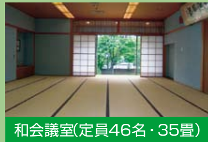
和会議室(定員46名・35畳)