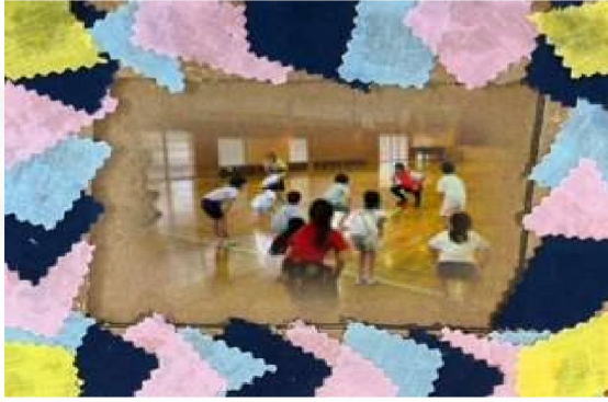
『遊ぶ前は準備運動をします』