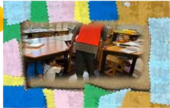
『9月も避難訓練を行いました』