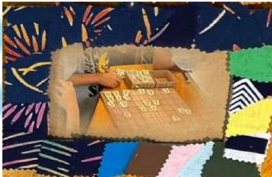
『将棋であたまをきたえています』