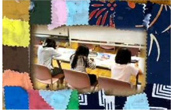
『まずは宿題にとりくみます』