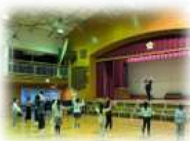
ダンス教室♪みんなでヒップホップ