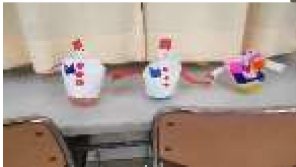
おきあがりこぼし作り