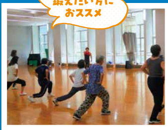
チャレンジエアロ、ダンベル筋トレ&ストレッチ、全身筋力トレーニング など