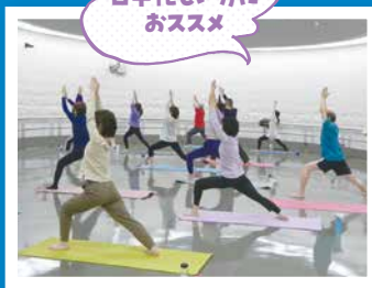
コンディショニングストレッチ、姿勢をととのえるアクティブヨガ、スッキリ! ボクシング