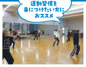
気功太極拳、ハワイアンフラ、ゆったり骨盤体操 など