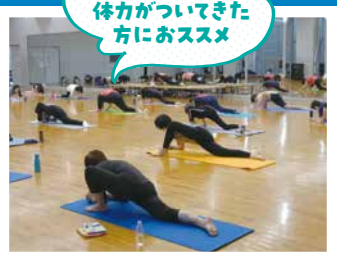
朝ヨガ、ゆがみを整えるベルビクストレッチ、ベーシックヨガ など