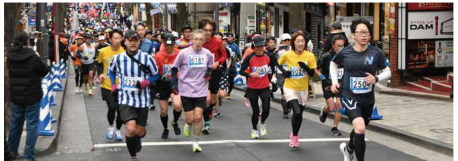
神楽坂を駆け上がるランナーの皆さん