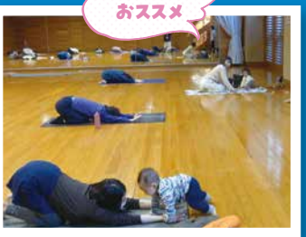
女性のための癒やしヨガ、骨盤調整ヨガ、代謝UPピラティス、親子リトミック(3B体操) など