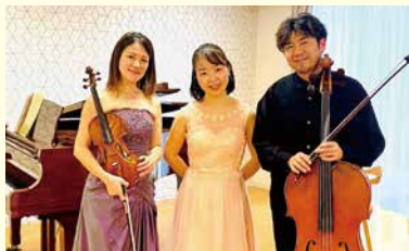
tre 3 bien