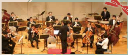
東京フィルハーモニー交響楽団のメンバーによるミニ・オーケストラ