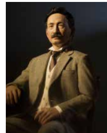
漱石アンドロイド