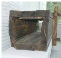
区内で出土した木樋

日 10月12日(土) 14:00~16:00 場 2階講堂 講 谷川章雄(早稲田大学名誉教授) 定 90名(多数抽選) 料 1,000円 申 ウェブサイト、または「往復はがき」に「記載例」(3面)のとおりに記入し、新宿歴史博物館へ。*1通につき1名のみ 締 9月25日(水)