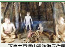
下高井戸塚山遺跡復元住居