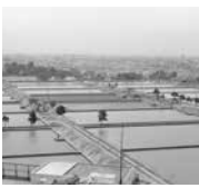
淀橋浄水場 昭和39年(1964)

日 展示中~12月25日(水) 9:30~17:30(入館は17:00まで) 休館日 第2・4月曜日(祝休日の場合は翌平日) 場 地下1階常設展示室特設コーナー 定 一般300円、小中学生100円