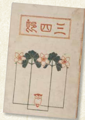
夏目漱石『三四郎』初版(春陽堂、明治42年)

日 10月12日(土)~12月15日(日) 10:00~18:00(入館は17:30まで) 休館日 月曜日(休日の場合は、直後の休日でない日) 場 2階資料展示室 ¥ 一般500円、小中学生100円 団体(20名以上)は個人の観覧料の半額。 小中学生は土日祝日無料。 ※障がい者手帳等をお持ちの方は手帳の提示で無料(介助者1名無料)