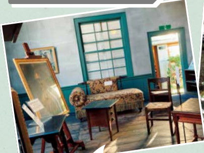
大正期のアトリエ建築を今に伝える、貴重な建物です。