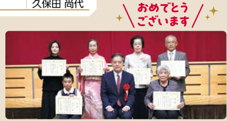
表彰式(11月24日) 区長賞受賞のみなさま