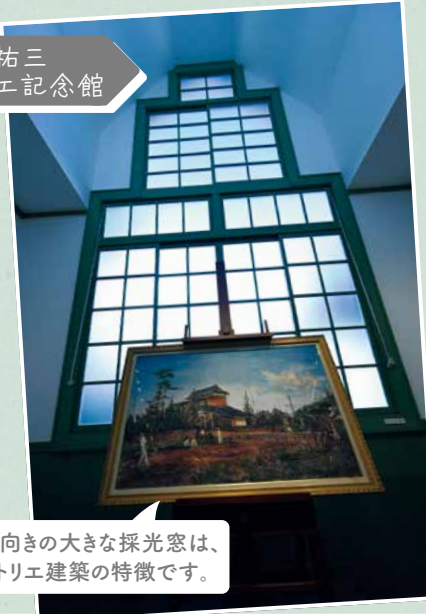
北向きの大きな採光窓は、アトリエ建築の特徴です。

漱石の書斎を再現。たくさんの本に囲まれた穏やかな空間をお楽しみください。フォトスポットをご用意しています!