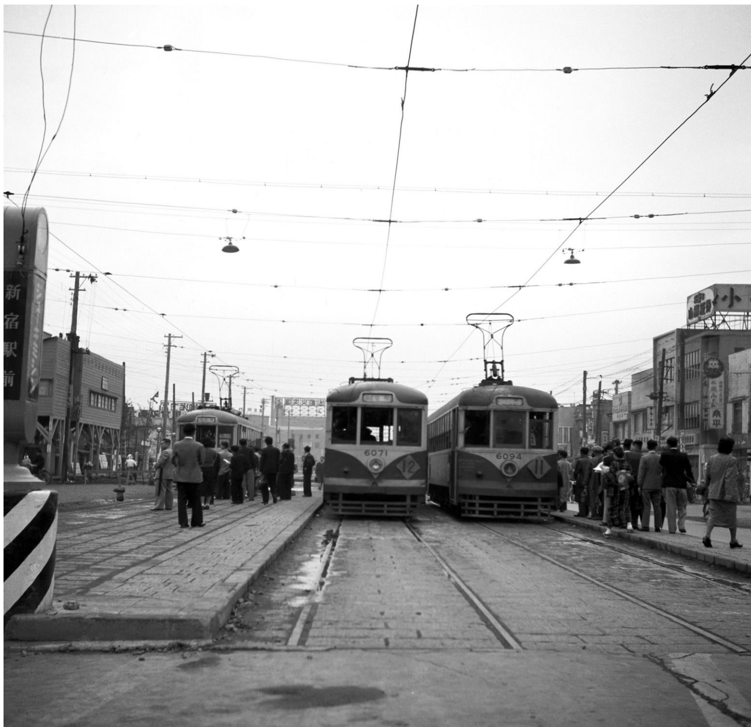
靖国通り 新宿駅前停留場 昭和20年代