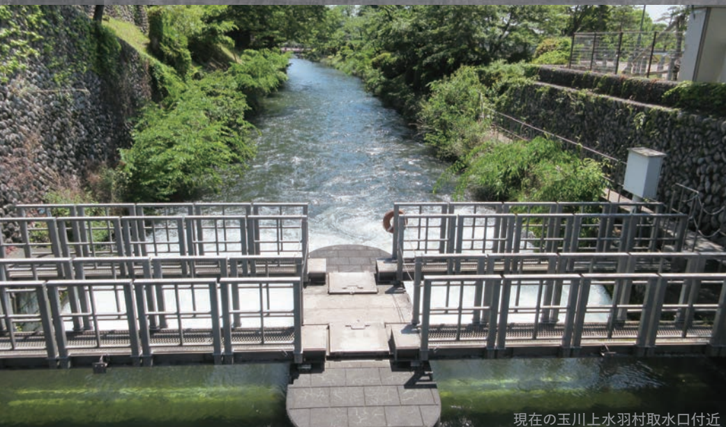
現在の玉川上水羽村取水口付近

〒160-0008 新宿区四谷三栄町12-16 TEL:03-3359-2131 FAX:03-3359-5036 https://www.regasu-shinjuku.or.jp/rekihaku/