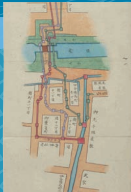
「玉川上水絵図」(部分) 明治時代初頭 東京都立中央図書館蔵

新宿区内には上水の水質・水量の管理を行う水番所があった他、神田上水への助水堀、渋谷川への余水吐・四谷見附の掛樋など、多くの関連施設がありました。玉川上水の歴史や江戸時代の水道利用について、古文書や絵図、発掘調査の成果などを通して紹介します。