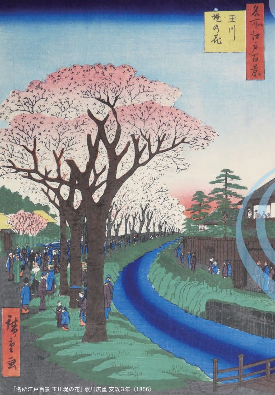
「名所江戸百景 玉川堤の花」歌川広重 安政3年（1856）