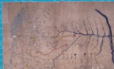
「江戸上水配水図」(千川家文書・練馬区指定文化財) 享保2~3年(1717~1718)頃 練馬区立石神井公園ふるさと文化館蔵