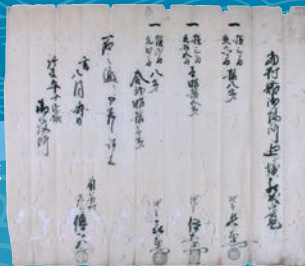
「当村站御場所廻シ堀ニ罷成候覺」